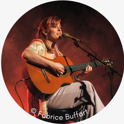
AIGRE DOUCE CHANSON

Issu du Tremplin A Thou Bout d'Chant 2024