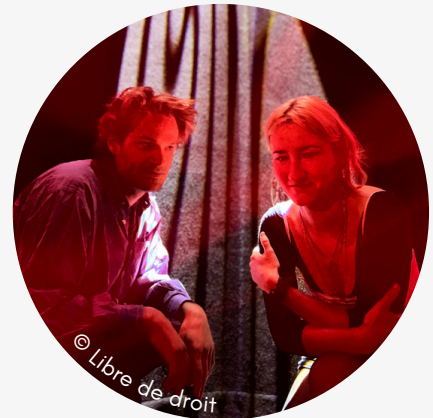
LIMINAL REMPART ETHERAL ÉLECTRO POP