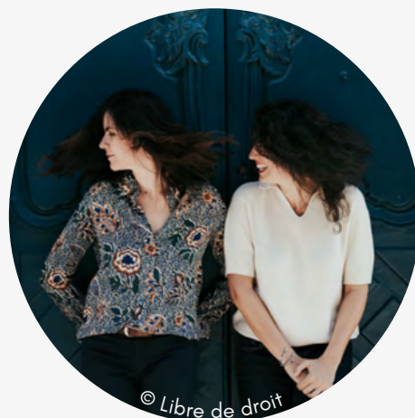
COMME JOHN POP CHIC

L'univers des deux soeurs est un trait d'union entre Françoise Hardy, Barbara, Les Beatles et la Grande Sophie, entre balades nostalgiques et petits tubes discodeïnes. Elles ont sorti 2 albums salués par les médias et ont sorti au printemps 2022 un nouvel EP "Été 80".