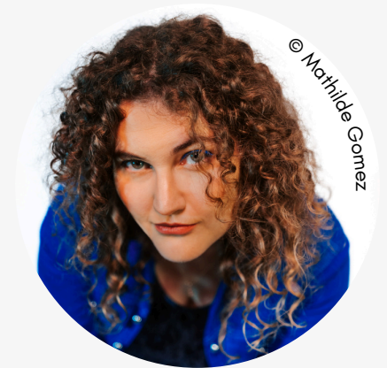
ELIA LA BOUCLÉE CHANSON

Issu de l'Appel à projet Festival FEMME(S) 2024