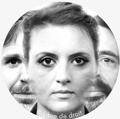
EL TIO CHANSON

Issu de l'Appel à projet Festival FEMME(S) 2024