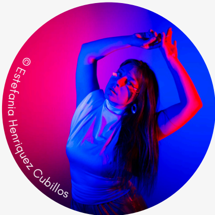
VIVA AUSTRALIS SYNTH POP

Viva Australis connaît l'intensité. Cette chanteuse-compositrice chilienne à la voix puissante peint ses chansons synth-pop éclectiques de différentes couleurs... des textes engagés, des rythmes dansants et même des baleines se transposant dans une ambiance intimiste. Vous aimez l'aventure ? Avec Viva, c'est parti !